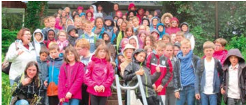
La centaine de CM1 et CM2 des deux écoles s'est rendue à Laval pour visiter 4 instances publiques.

En récompense de leur investissement et de leur sérieux, les jeunes élus ont eu plusieurs belles surprises. Lundi 23 mai, d'abord, les enfants ont eu l'honneur de présenter un topo résumant leurs travaux à leurs aînés lors d'un véritable conseil municipal (organisé à la salle polyvalente afin de permettre à leurs parents d'y assister). Autour des tables, les enfants étaient intercalés avec les conseillers adultes. Un grand moment de fierté pour les écoliers.