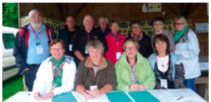
Les bénévoles du Télé-Proton53 lors de la randonnée proposée sur le site des Perles..