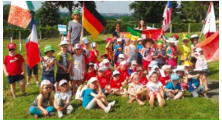
Les enfants ont vécu des JO plus vrais que nature le 8 juillet.

Une journée inter-centres intercommunale s'est par ailleurs tenue le 8 juillet, avec 130 enfants répartis entre les stades d'Averton et de Pré-en-Pail. En lien avec l'actualité sportive, ils y ont vécu leurs propres Jeux Olympiques... Grandes sorties (parc de l'Ange Michel, Refuge de l'Arche), découvertes (le thème du mois d'août), jeux de plein air et piscine ont complété ce beau programme d'été.