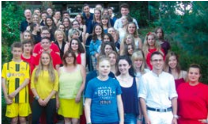
Le dernier soir, les jeunes se sont habillés aux couleurs des drapeaux allemand et français.