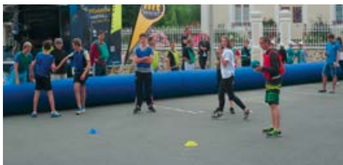
Le Phénoménal Handball Tour a animé la journée et beaucoup plu aux jeunes.