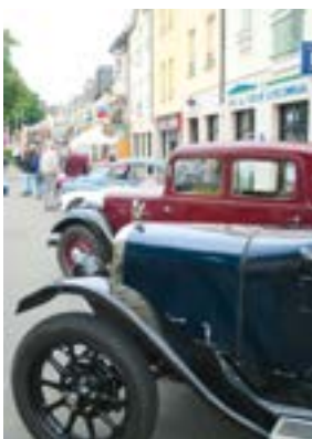
Le charme des vieilles cylindrées a opéré.