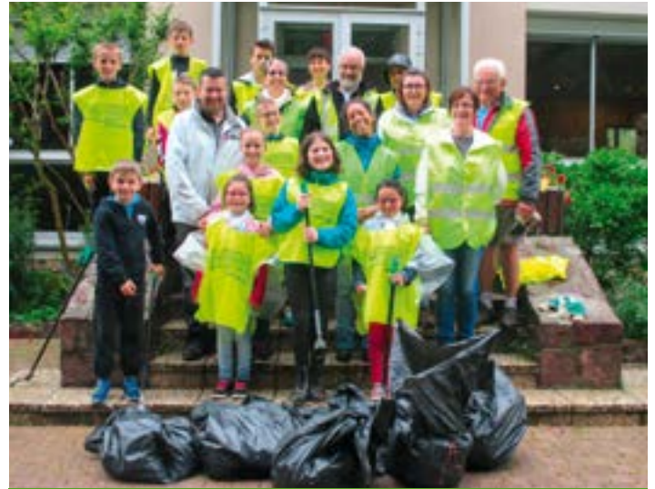
Le 11 juin, une équipe motivée a ratissé les rues de la commune et récolté près de 40 kg de déchets.

Parmi les pistes qui pourraient se concrétiser plus tard, la municipalité envisage sérieusement la création d'un city park