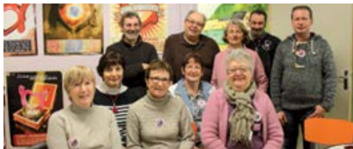
Une partie de la vingtaine de bénévoles des Restos.

90 foyers (210 personnes) sont actuellement aidés. « L'appauvrissement des gens se voit au fait qu'ils restent