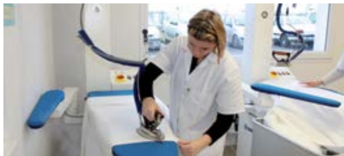
La Blanchisserie des Avaloirs emploie déjà 14 personnes. Elle est ouverte du lundi au vendredi de 8h à 17h.

L'association Études et Chantiers est implantée physiquement à Villaines-la-Juhel depuis fin 2012 autour d'un chantier d'insertion axé sur l'environnement (entretien et aménagement d'espaces naturels) et le bâtiment (rénovation, avec pour spécialité le bâti ancien). « Il n'est pas question de concurrencer les entreprises du